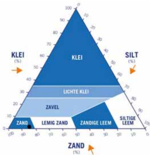
FIGUUR 2: STIP IS HUIDIGE GRONDSOORT IN GEBIED 'T KLOOSTER.

uit zand bestaat met een slechts 20 à 30 cm dikke humushoudende bouwvoor. De capaciteit om regenwater vast te houden is gering en daardoor is het gebied gevoelig voor uitspoeling van meststoffen die in het hangwater zijn opgelost. Omdat ook de diepe ondergrond bestaat uit goed doorlatende zandlagen wordt in 't Klooster drinkwater gewonnen. Ruw drinkwater waar we zuinig op zijn.